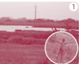
行衛の「芝川第一調節池」。さっそく登山スタート!