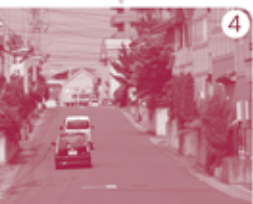
この坂を上ると目的地に。