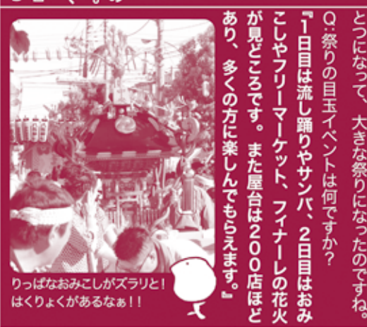
りっぱなおみこしがズラリと! はくりよくがあるなあ!!

Q:「たたら祭り」の「たたら」とは何ですか? 『鑄物(いもの)をつくる時、鉄を溶かすために風を送る道具の「鞴(ふいご)」を意味します。川口市は鑄物が地域を代表する産業なので、それにちなんで「たたら祭り」となりました。』 なるほど、鑄物から由来しているのですか。ち