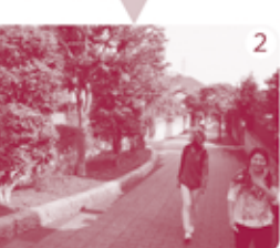
差間遊歩道をとぼとぼと。いいところですね。