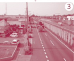
東北自動車道を「西通り橋」で横断。