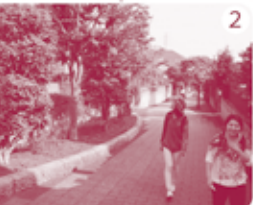
差間遊歩道をとぼとぼと。いいところですね。