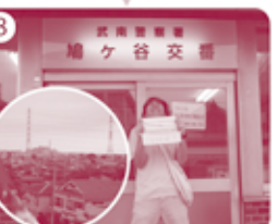
8 鳩ヶ谷交番到着! ■高低差約21m ※うらの細い道へ行くといじい眺め