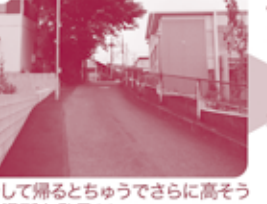
9 そして帰るとちゅうでさらに高そうな場所を発見!!

次号予告 次号は11月号! ゴリラ?キリン?川口めいぶつ公園川口のじまん!いもの工場にせまる!!川口まめちしき人口についてお楽しみに!