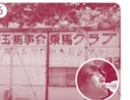
6 再び芝川第一調節池からスタート。木曾呂の乗馬クラブを通過。※こまめに水分補給!