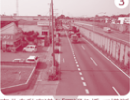
3 東北自動車道を「西通り橋」で横断。