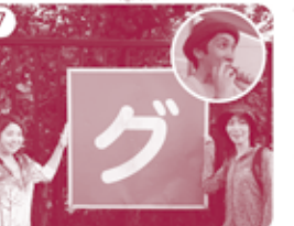
7 グリーンセンターの脇を通過。※途中で食糧を補給する隊員