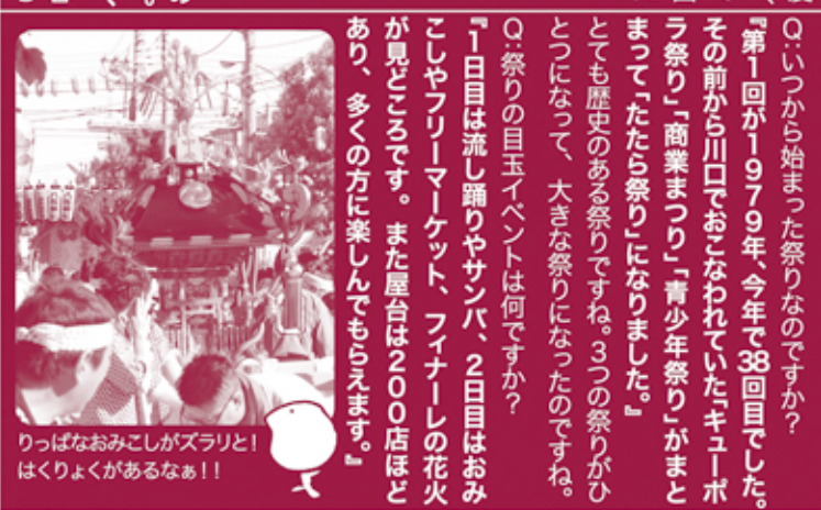
りっぱなおみこしがズラリと!はくりよくがあるなあ!!

Q:「たたら祭り」の「たたら」とは何ですか? 『鑄物(いもの)をつくる時、鉄を溶かすために風を送る道具の「鞴(ふいご)」を意味します。川口市は鑄物が地域を代表する産業なので、それにちなんで「たたら祭り」となりました。』 なるほど、鑄物から由来しているのですか。ち