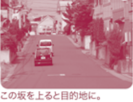
4 この坂を上ると目的地。