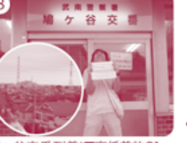
8 鳩ヶ谷交番到着!■高低差約21m ※うらの細い道へ行くといよいよ険め