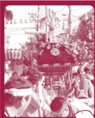
りっぱなおみこしがズラリと! はくりよくがあるなあ!!