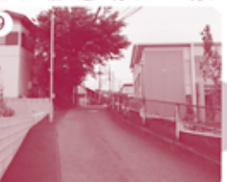
9 そして帰るとちゅうでさらに高そうな場所を発見!!

次号予告 次号は11月号! ●ゴリラ? キリン? ●川口めいぶつ公園 ●川口のじまん! ●いもの工場にせまる!! ●川口まめちしき人口について お楽しみに!