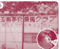
6 再び芝川第一調節池からスタート 木曾呂の乗馬クラブを通過 ※こまめに水分補給!