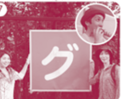
7 グリーンセンターの脇を通過 ※途中で食糧を補給する隊員