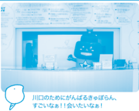
川口のためにがんばるぎゅぼらん、すこいなあ!! 会いたいなあ!

川口市内には、川口自然公園(4位)や戸塚中台公園(9位)の様な緑豊かな公園も多くあります。この夏、川口の公園に生き物調査に行ってみませんか? くれぐれも安全に気を付けてください!