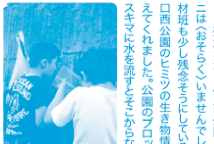
なにかでてくるのかな?

水遊び場付近にいた小学生によると、ここでザリガニをさがしているのと。しかし、石をどかしてもどこをさがしても見つからない! つかまえて教室で飼育(かいよく)している予定だったそうですが、残念ながら川口西公園にザリガニは(おそろしく)いませんでした。取材班も少し残念そうにしていると、川口西公園のヒミツの生き物情報を教えてくれました。公園のブロック塀のスキマに水を流すとそこらなと! ヤモリがあらわれたこともあるそうで、何やら川口西公園に生息する生き物はまだまだなぞが多いかもしれません。ザリガニも本当はいるのでは?!