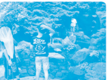
水遊びもできるんだ! なにか生き物があるのかなあ。

平日の15時くらいの公園内は、大人から子どもまで多くの人がいきました。中でも、虫取りアミや虫かごを持って小学生が意外に多い! 駅前の公園に生き物などいろいろのなかなと思ひ、少し話を聞いてみました。