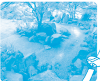
川口駅西口から徒歩1分。すずしげで気持ちいいなあ。

1位になった「川口西公園(リリアパーク)」は、平成3年に出来た公園で、面積は31,039㎡。災害避難(さいがいひなん)広場として必要な機能をそなえた川口市じまんの都市型公園です。園内にはたくさん彫刻(ちようこく)や遊具、水遊びができる場所があり、また春には公園いっばいに咲くさくらが川口の新名所となっております。広場を利用してドラマや映画の撮影場所としてもよくつかわれています。