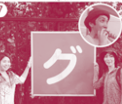
7 グリーンセンターの脇を通過。 ※途中で食糧を補給する隊員