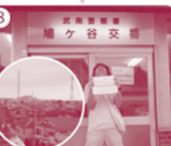
8 鳩ヶ谷交番到着! ■高低差約21m ※うらの細い道へ行くといよいよ!