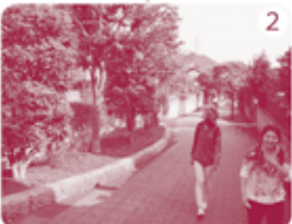
2 差間遊歩道をとぼとぼと。いいところですね。