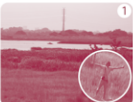
1 行衛の「芝川第一調節池」。さっそく登山スタート!