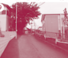
9 そして帰るとちゅうでさらに高そうな場所を発見!!

次号予告 次号は11月号! 『ゴリラ? キリン? 川口めいぶつ公園 川口のじまん! 川口の工場にせまる!! 川口まめちしき 人口について 楽しみに!』