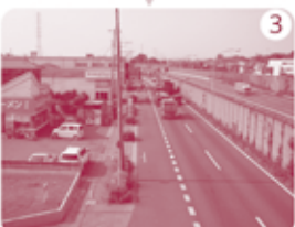
3 東北自動車道を「西通り橋」で横断。