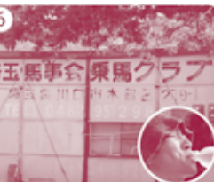
6 再び芝川第一調節池からスタート。木曾呂の乗馬クラブを通過。 ※こまめに水分補給!