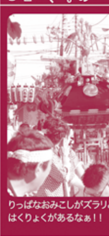
りっぱなおみこしがズラリと! はくりよくがあるなあ!!

Q:「たたら祭り」の「たたら」とは何ですか? 『「鑄物(いもの)をつくる」の「鑄(い)」「物(もの)」を意味します。川口市は鑄物が地域を代表する産業なので、それにちなんで「たたら祭り」となりました。』 なるほど、鑄物から由来しているのですか? 『たたら祭りの「たたら」とは何ですか? 『鑄物(いもの)をつくる」の「鑄(い)」「物(もの)」を意味します。川口市は鑄物が地域を代表する産業なので、それにちなんで「たたら祭り」となりました。』