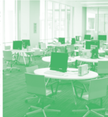
DVDを見る専用の席もあるんだよ。土日祝日は小中高生がたくさん来てにぎわっているよ。

みなさんもおなじみの、インターネットがつかえるパソコンのある席の貸し出しをしています。ここワークスタジオAというスペースは市内小中高生は無料で3時間まで、大人は1時間100円でパソコンをつかうことができます。