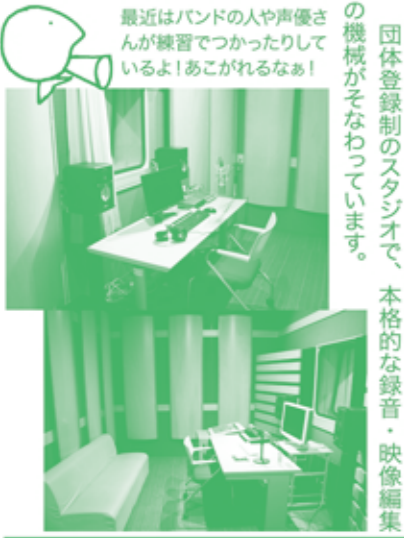
最近バンドの人や声優さんが練習でつかっているよ！あこがれるなあ！