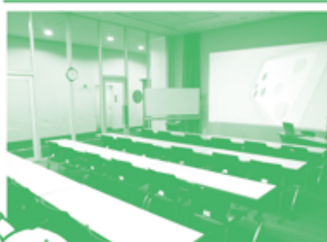
ガラス張りだから開放感があるよ。メディアセブンがやっているパソコン講座もここでやるんだ。

▼コミュニケーションスタジオ 30名ほどがつかえる部屋です。会議や打ち合わせでつかっているようですね。