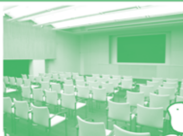
大きなスクリーンでみる映画は迫力あるよ！夏休みや冬休みにはこども向けアニメも上映するんだ。

▼プレゼンテーションスタジオ 100人が入れるメディアセブンで一番大きな部屋です。またメディアセブンの無料の上映会もここで開催しています。